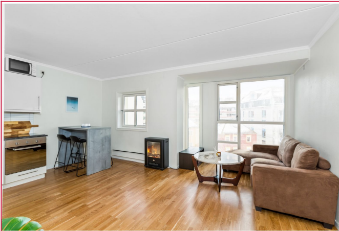
Leiligheten ligger i 4. etasje