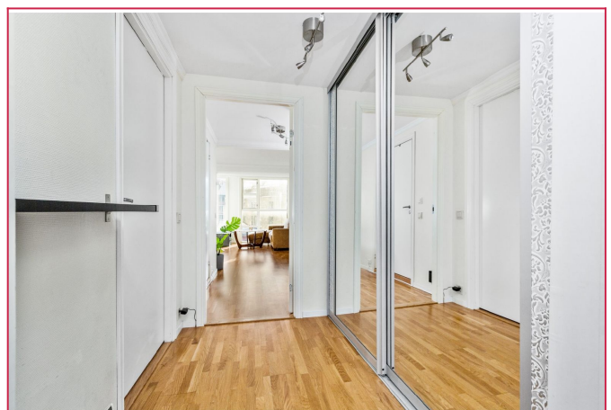
Gang med romslig skyvedørgarderobe.