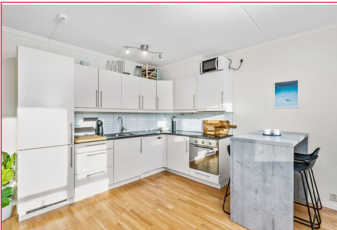
Integrert kombiskap og komfyr. Oppvaskmaskin følger også med.