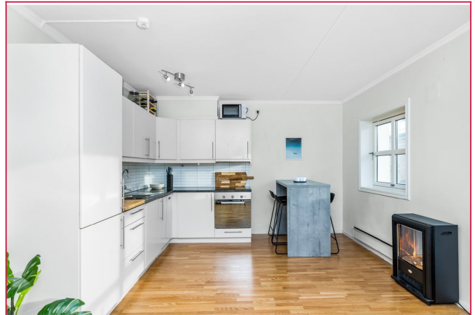
Åpen løsning mellom stue og kjøkken