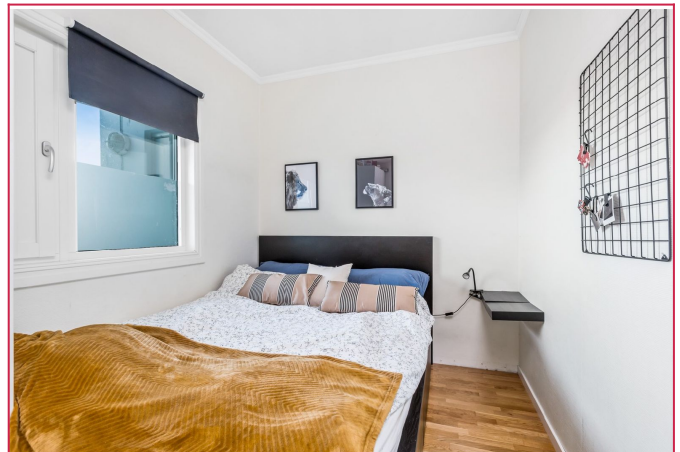
Soverom ut mot bakgården.