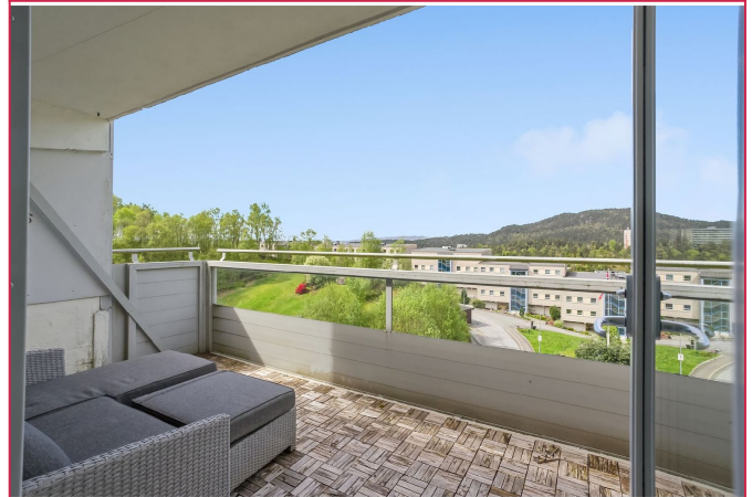
Balkong med sol store deler av dagen