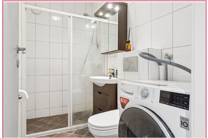
Bad med vaskemaskin