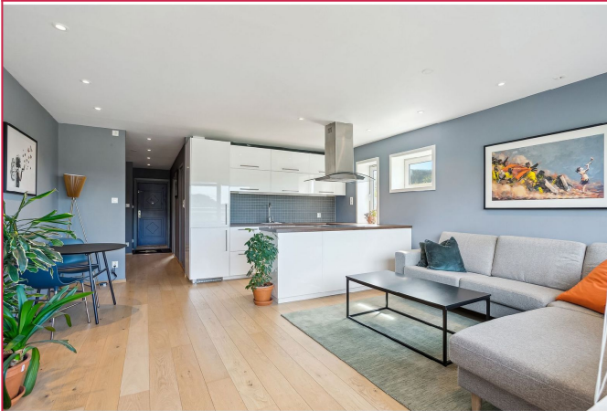
Flott stue med åpen kjøkkenløsning