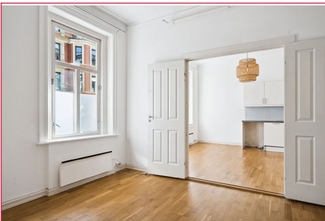
Soverom fra stue 1.