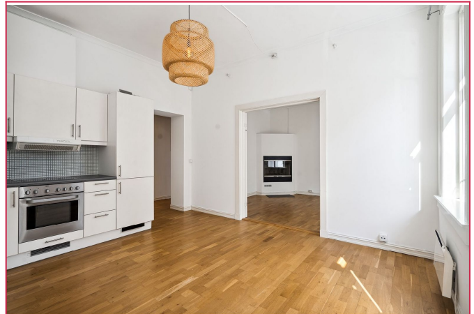
Plass til sofa med medfølgende møblement.