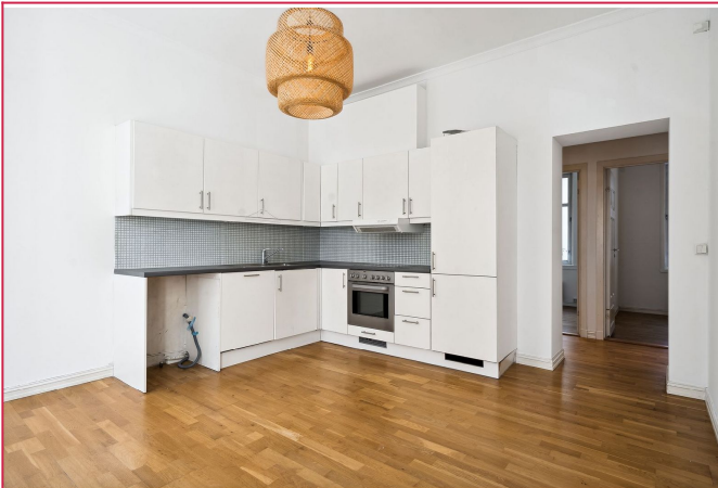
Stue med åpen kjøkkenløsning. Opplegg for vaskemaskin.