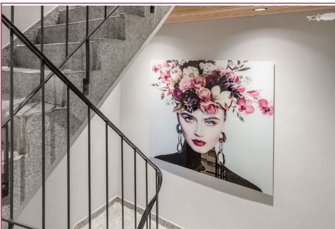
Flotte fellesareal med kule detaljer og bilder