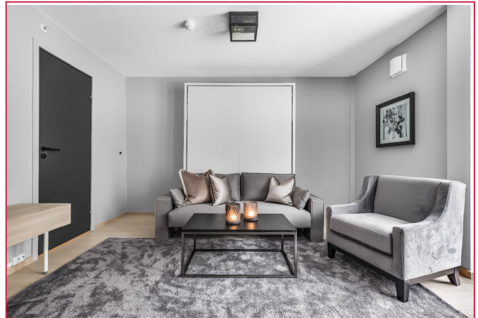
Stue med skapseng/sofa av høy kvalitet som er enkel å bruke