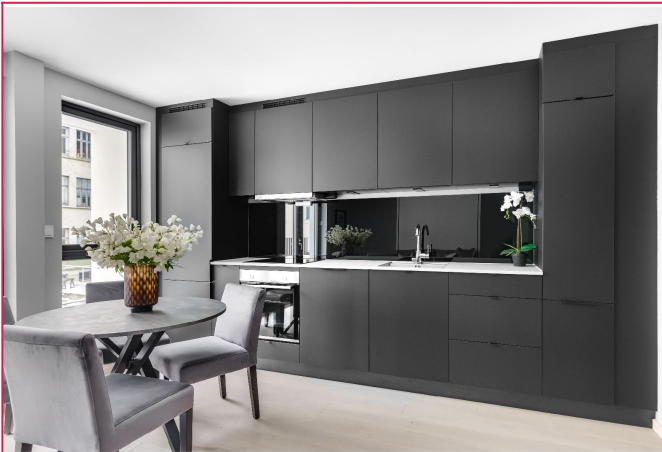
Kjøkken med integrerte hvitevarer