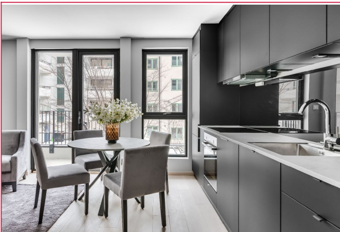
Plass til hyggelig spisestue mellom kjøkken og sofadel