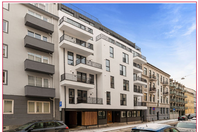
Fasade, bygget er det hvite i midten og fremstår som helt nytt og med gjennomført god standard