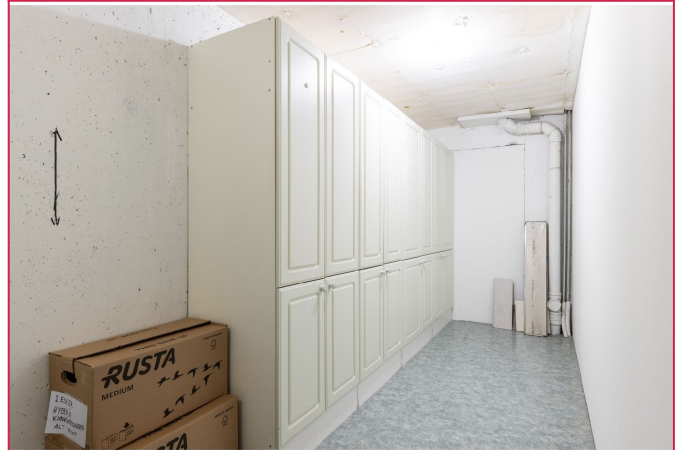
Romslig bod med god oppbevaringsplass – praktisk og lett tilgjengelig. Bodan deles med nabo.