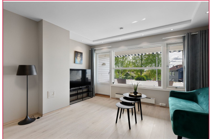
Tilbake i leiligheten.