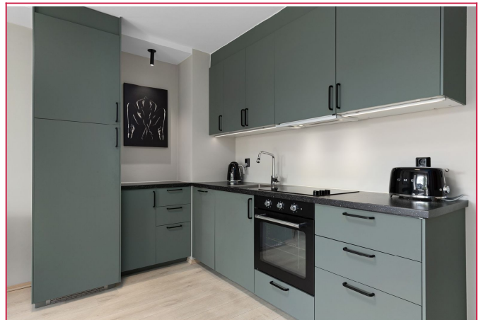
Kjøkkenet med integrerte hvitevarer med god skap og benk-plass.