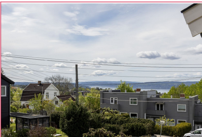
Velkommen til visning!