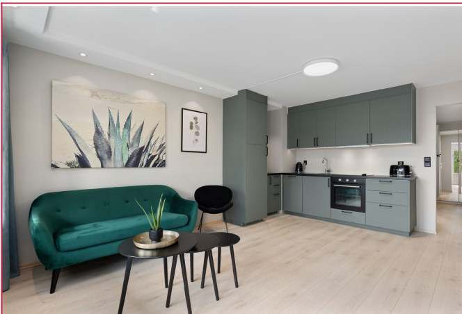
Lun, åpen stue/kjøkken løsning. Et rom for avkobling og hygge.