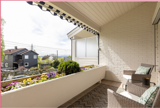
Solrik balkong med elektrisk markise!