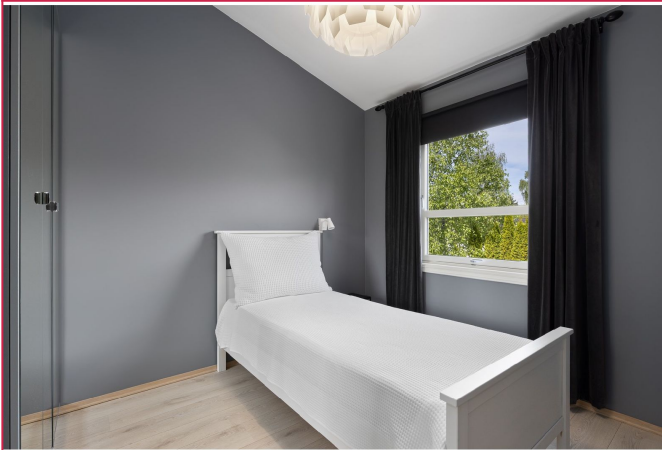
Romslig soverom med garderobeskap og god plass til dobbeltseng. Seng medfølger ikke.