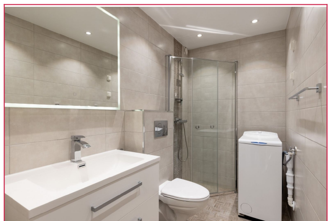
Flislagt baderom med varmkabler i gulv. Vaskemaskin medfølger.