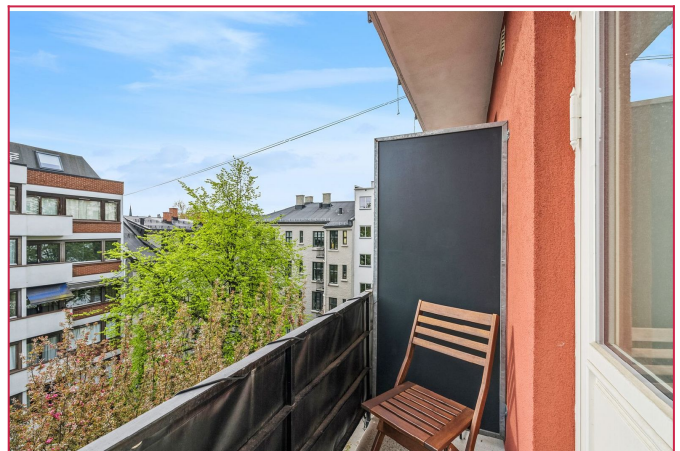
Balkong med utgang fra stuen. Vender mot bakgård.