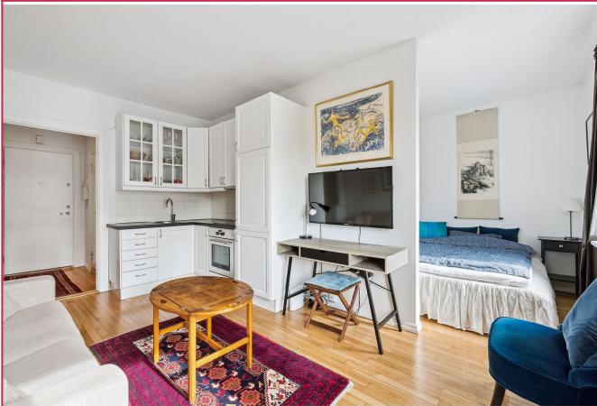
Leiligheten holder en god planløsning.