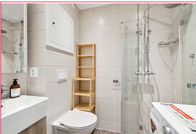
Pent flislagt bad. Her er det kombi vask og tørk.