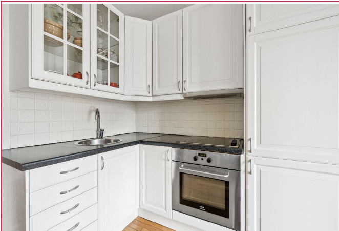
Pent kjøkken i åpen løsning mot stue.