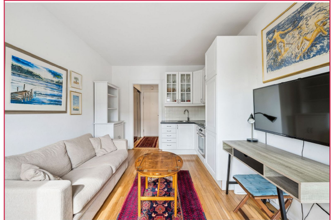
Leiligheten er møblert.