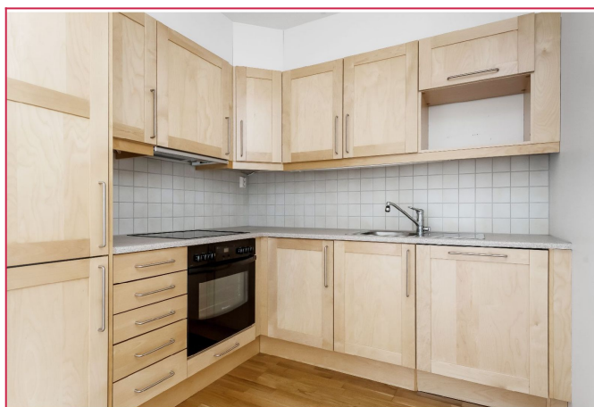
Kjøkkenet med integrert komfyr, kombiskap og oppvaskmaskin.