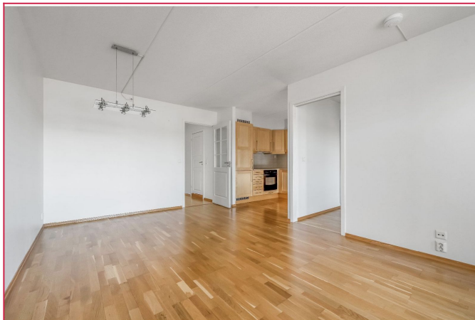
Stuen i åpen løsning med kjøkkenkrok. Det er også direkte tilgang til balkong.