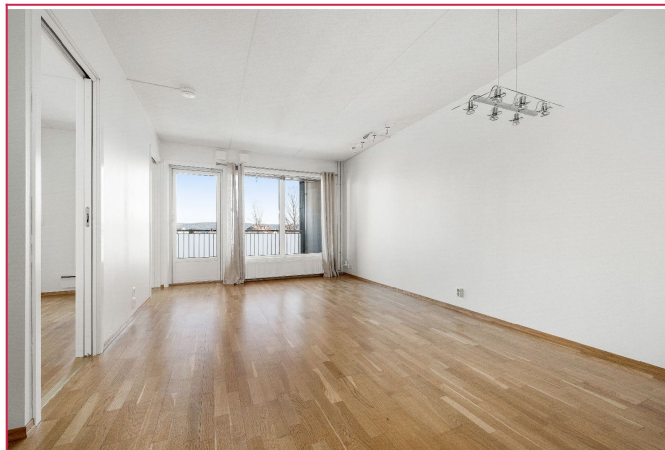
Soverommet har to skyvedører mot stuen.