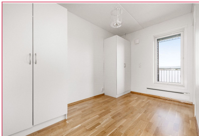
Soverom med to garderobeskap.