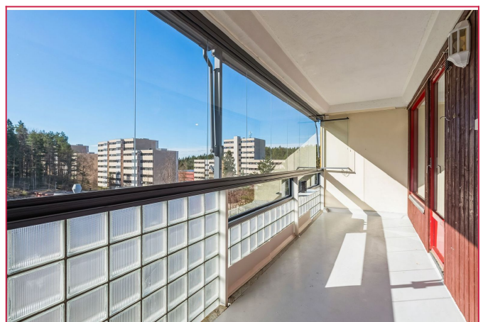
Fra stuen er det utgang til flott innglasset balkong på ca. 12 kvm.