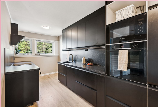
Pent kjøkken med god skaplass og integrerte hvitevarer.