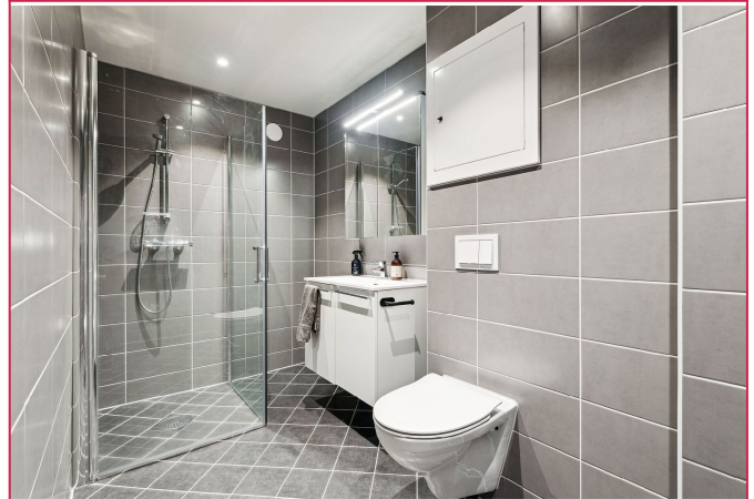
Delikat flislagt badrom med varme i gulv, både badet og separat vaskerom ble pusset opp i 2023.