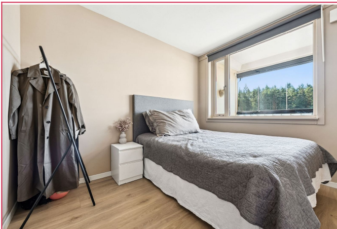
Boligen består av tre lyse soverom.