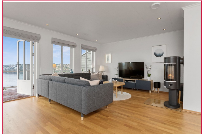
Stue med peis og utgang til balkong med nydelig sjøutsikt