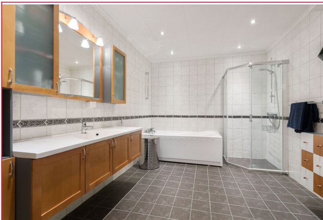
Bad i 1. etg