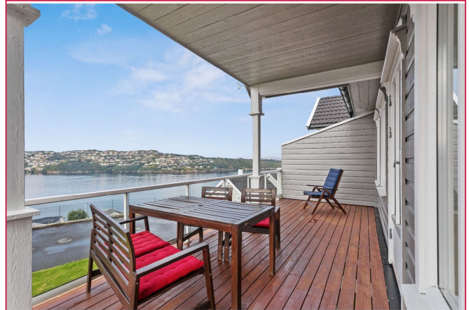
Herlig sjøutsikt fra terrasse