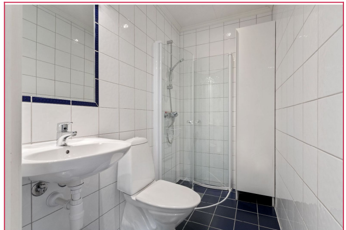
Bad i 2.etg