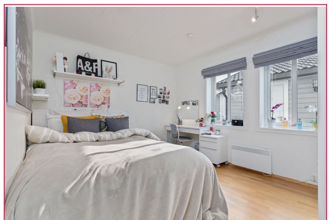
Soverom i 1. etg