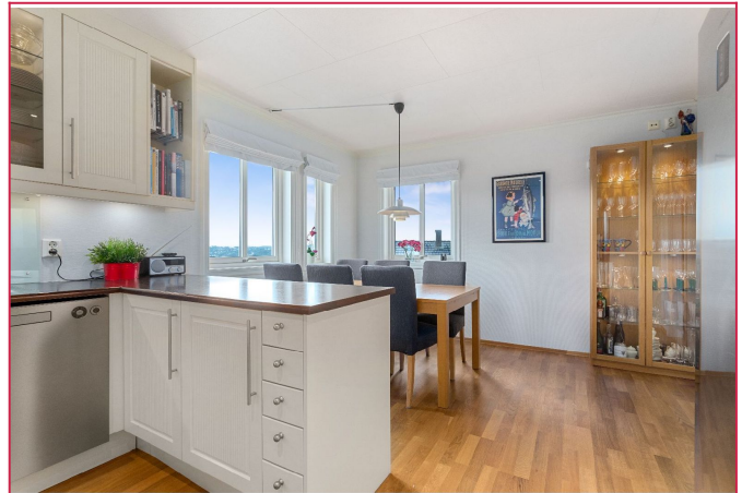
Kjøkken med spiseplass