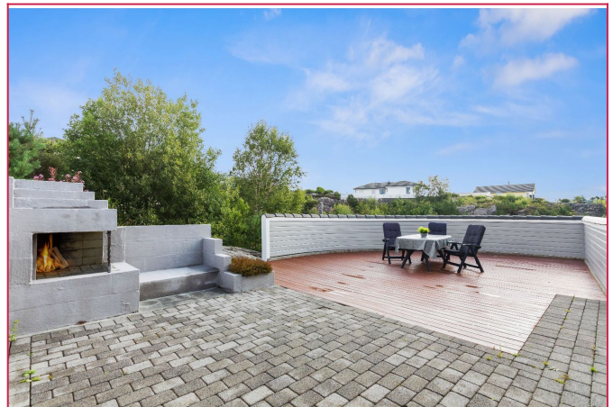
Terrasse på baksiden av boligen, med utepeis