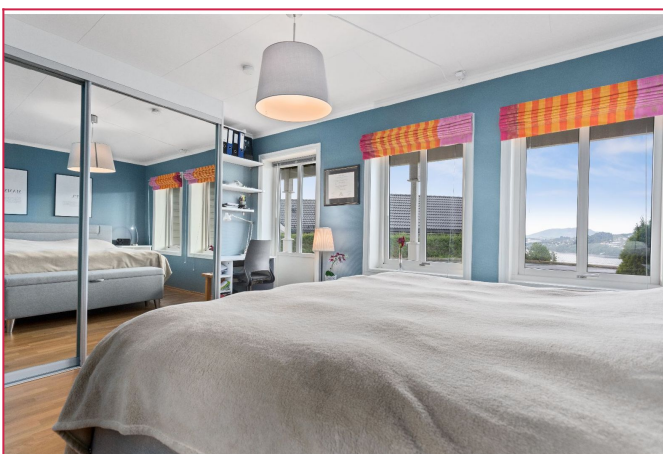
Hovedsoverom i 1. etg med utgang til hage/plen