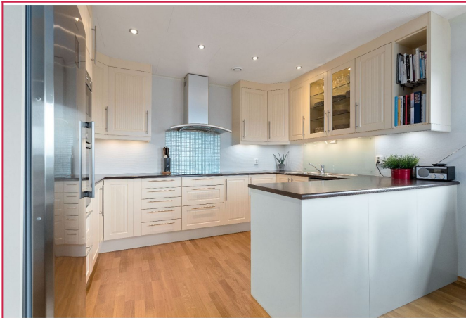
Kjøkken med alle hvitevarer