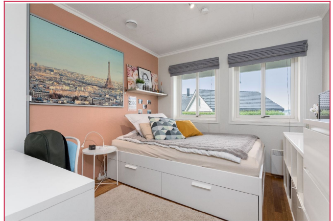
Soverom i 1. etg