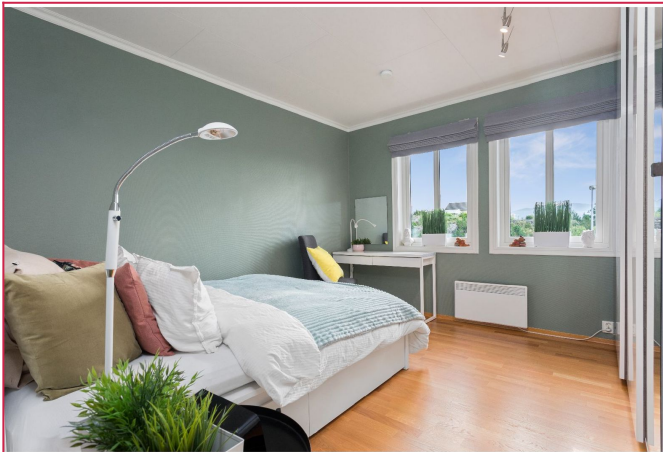
Soverom i 2.etg