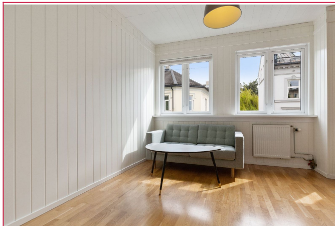
Oppvarming er inkludert.