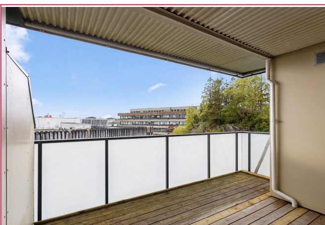
Fra stuen er det direkte utgang til en stor balkong med flott utsikt over nærområdet