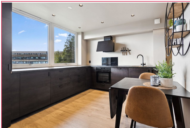
Kjøkkenet har godt med skap, skuffe og benkeplass