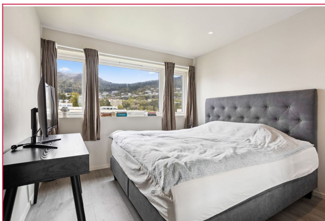
Hovedsoverom er av god størrelse og kan innredes etter ønske