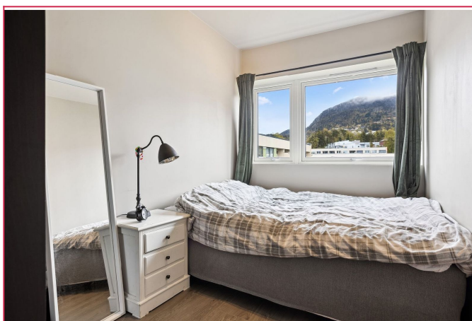
Romslig og lyst soverom med god plass til oppbevaring og naturlig lys