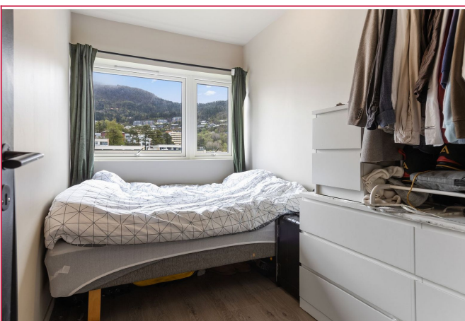
Leiligheten leies ut møblert, med unntak av senger