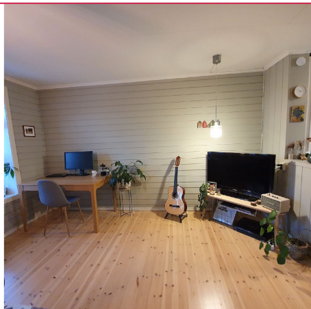
Boligen leies ut møblert.