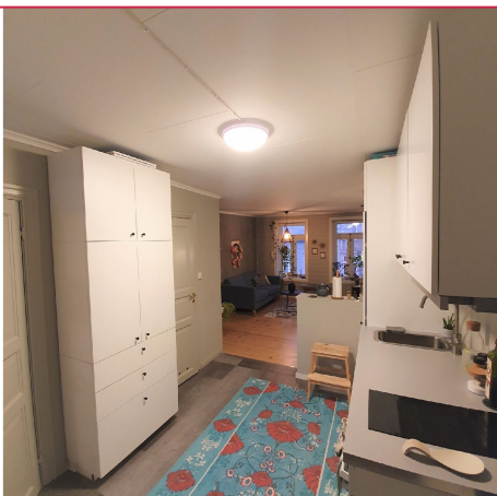
Kjøkkenen med god skap- og benkeplass.