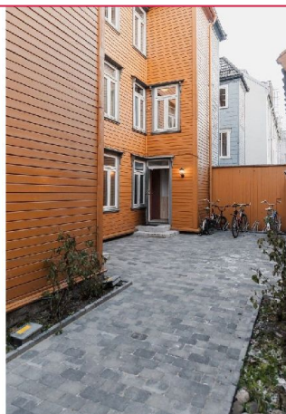
Rolig lukket bakgård.