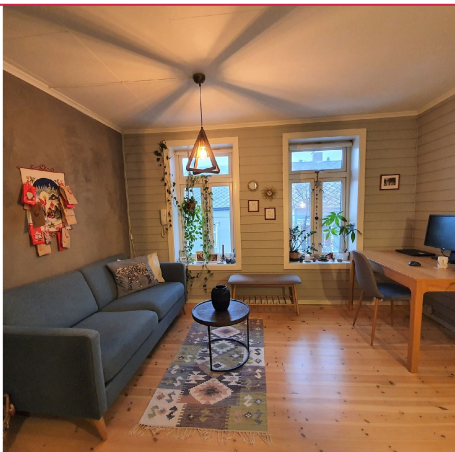
Leiligheten har en praktisk planløsning.