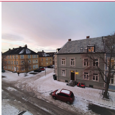
Utsikt fra leiligheten.