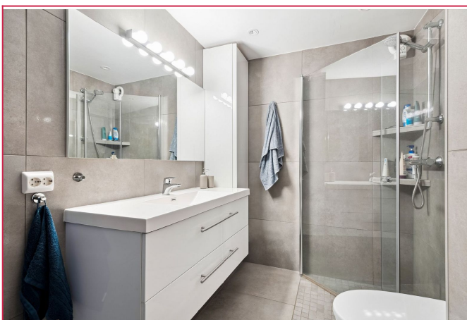
Bad fra 2019 på 6,65 kvm med spotter i tak og varmekabler i gulv. Vaskemaskin inkludert.