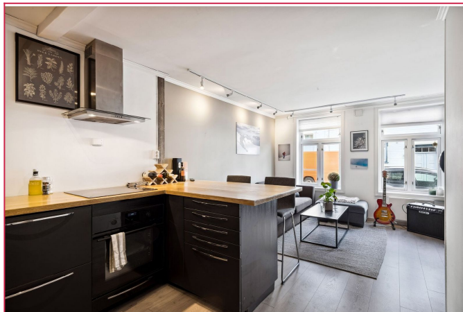
Åpen stue-/kjøkkenløsning med kjøkkenøy, sofagruppe og store vindu som gir godt lysinnslipp