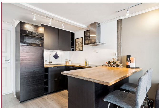
Kjøkkenen fra 2016 med integrerte hvitevarer og godt med skap- og benkeplass