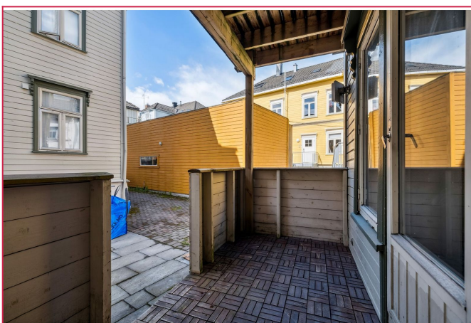
Veranda vendt mot bakgård med utgang fra soverommet.