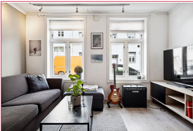
Stue/kjøkken er på 20 kvm til sammen. Sofagruppe og tv følger med.