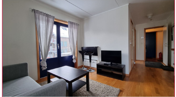
Stue, utgang til balkong av god størrelse