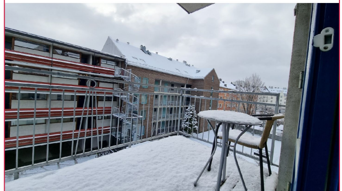
Balkong mot bakgård