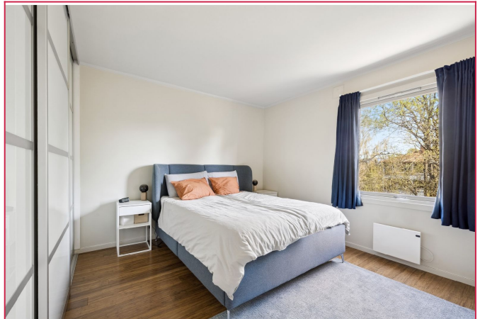
Hovedsoverom med skyvedørgarderobe