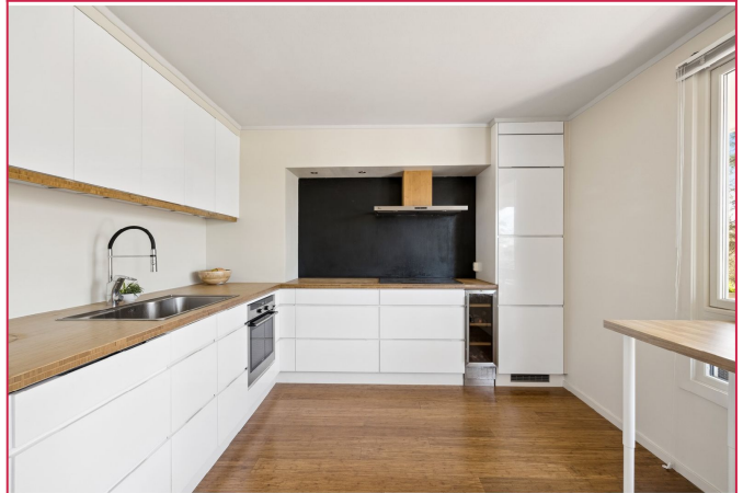
Stort og romslig kjøkken med integrerte hvitevarer