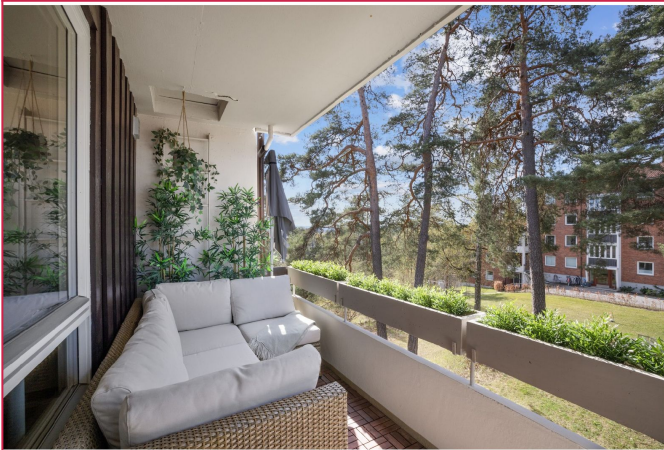
Stor og koselig balkong med gode solforhold