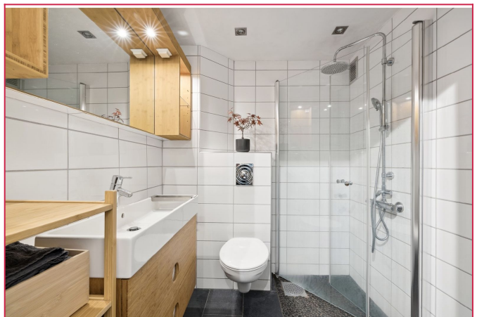
Flott bad med vaskemaskin/tørketrommel