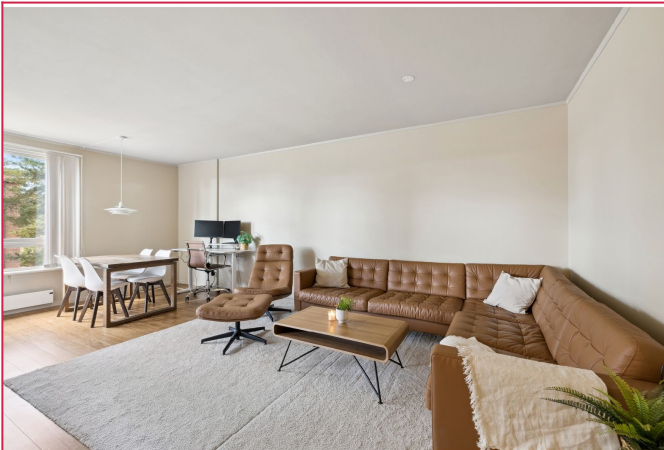
Stor og åpen stue med god plass til sofa og spisebord