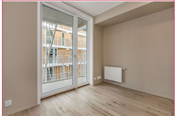
Utgang til balkong