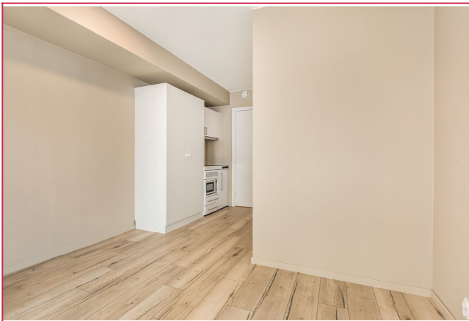
Lys og romslig stue