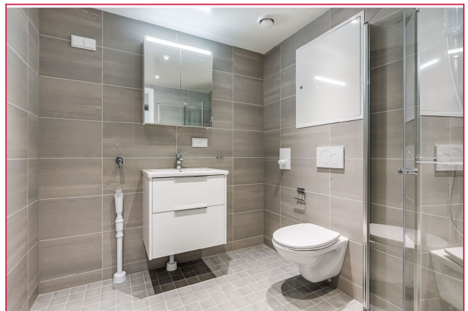
Flislagt bad med opplegg til vaskemaskin