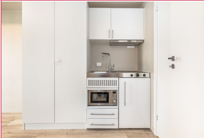
Kjøkkenløsning med hvitevarer og garderobeskap for oppbevaring