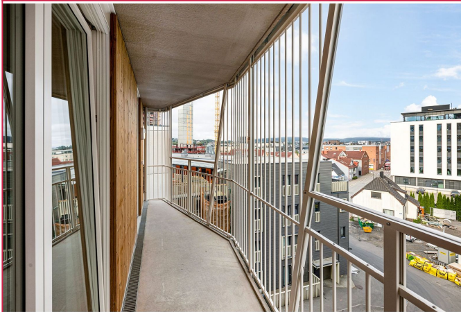
Utsikt fra balkong - Denne deles med nabo.