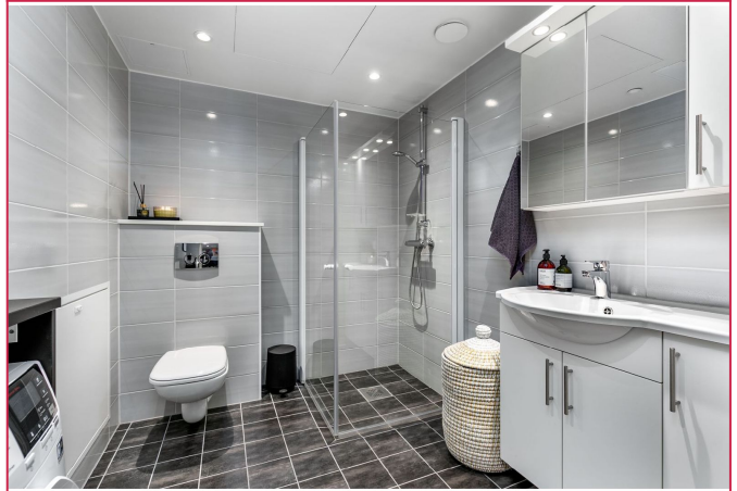
Pent flislagt bad med opplegg for vaskemaskin.