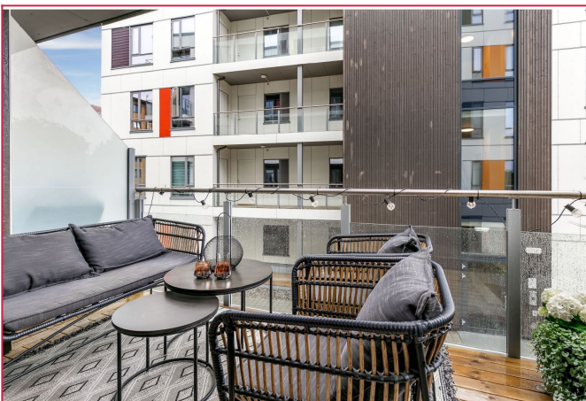
Balkongen har fin plass til utemøbler.