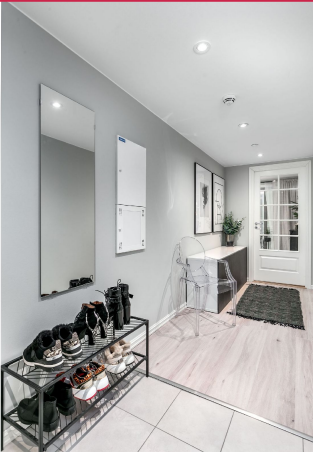
Entré med flislagt gulv.