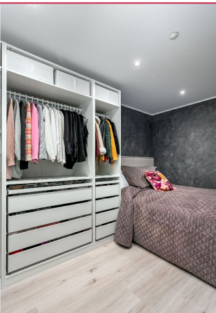
Soverom med garderobeløsning.