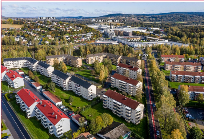
Oversiktsbilde av beliggenhet.