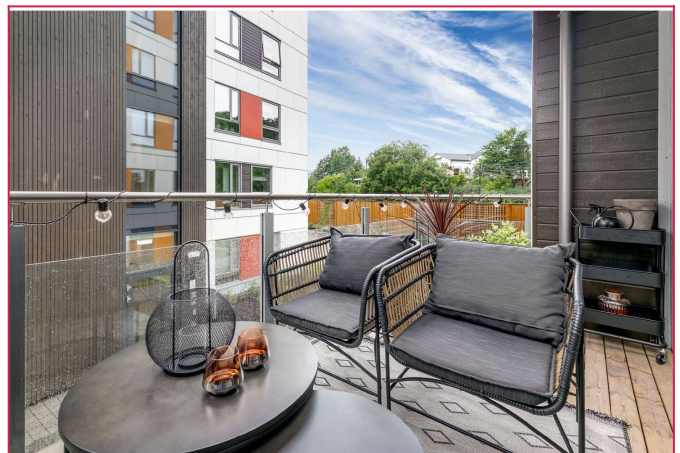
Balkong. Interessert i denne boligen? Send meg en henvendelse via annonsen med litt informasjon.