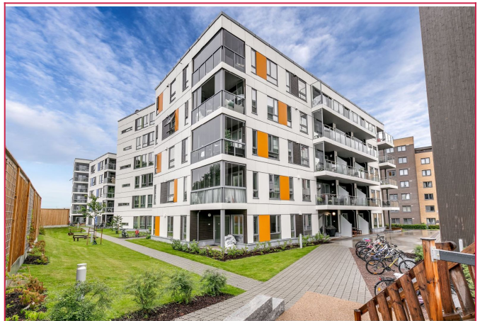
Fasade. Boligen ligger med kort vei til flere fasiliteter.