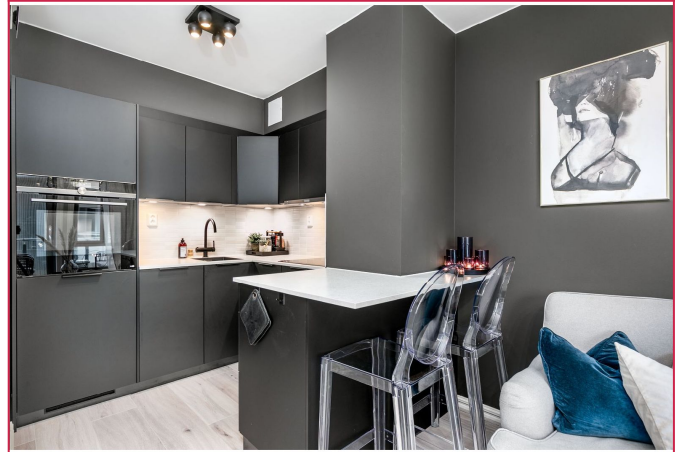
Pent kjøkken med hvitevarer.