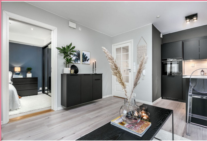
Pen og lys stue.