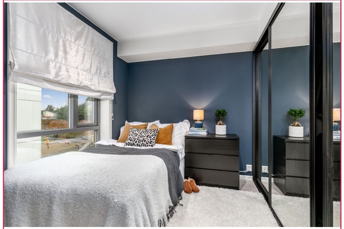
Soverom utstyrt med en skyvedørgarderobe.