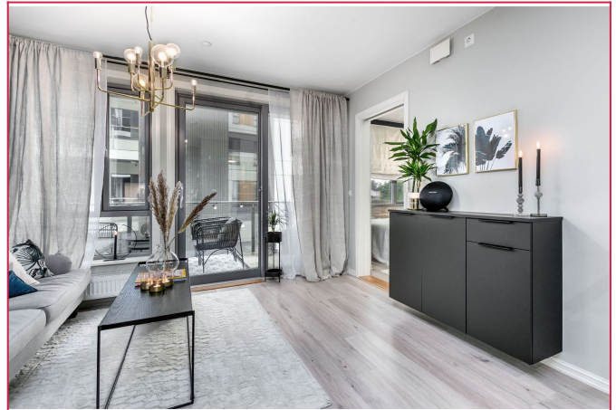
Fra stuen har man utgang til balkongen.