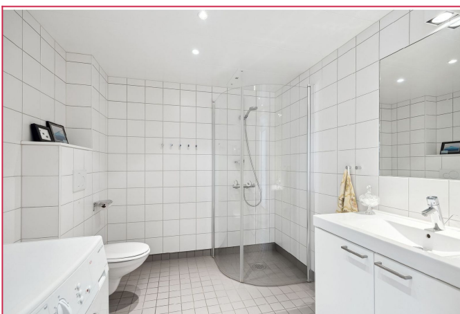
Delikat bad med vaskemaskin