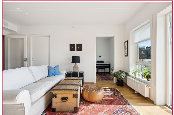
Lys og fin stue