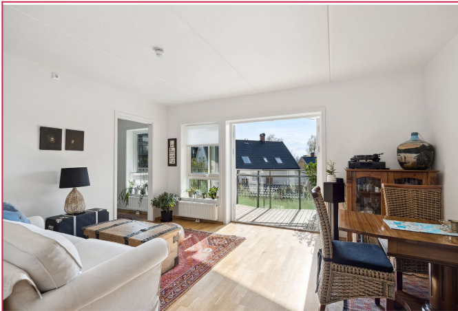
Fra stuen ut mot solrik balkong