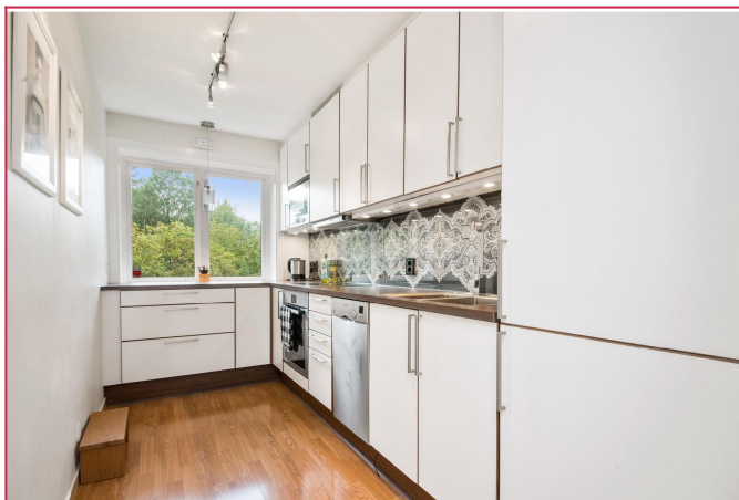
Flott kjøkken med god skap-og benk plass.