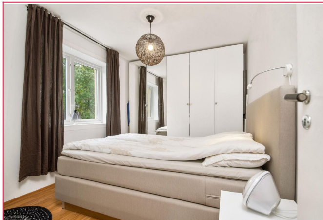
Romslig soverom med god plass til klesoppbevaring.