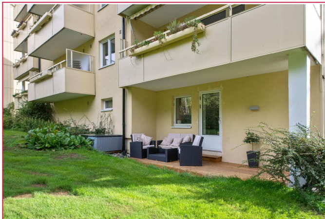
Leiligheten ligger i rolige og barnevennlige omgivelser.