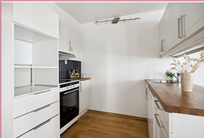
Velutstyrt kjøkken med komfyr, oppvaskmaskin og kombiskap