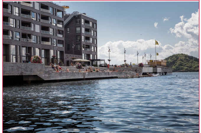
Nærhet til Sørenga som byr på bademuligheter, flere restauranter og yrende liv