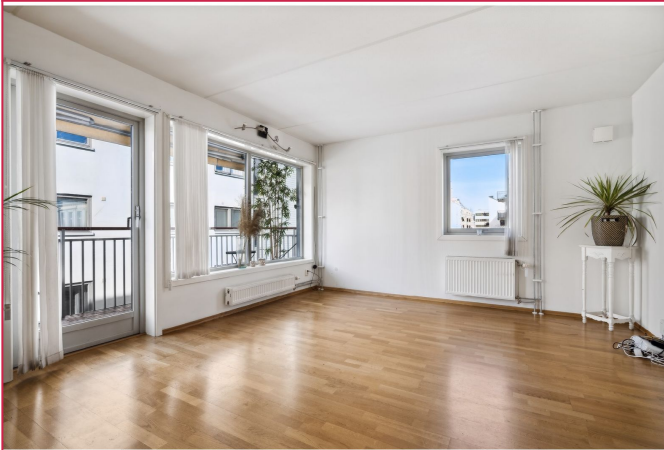
Lys og luftig stue