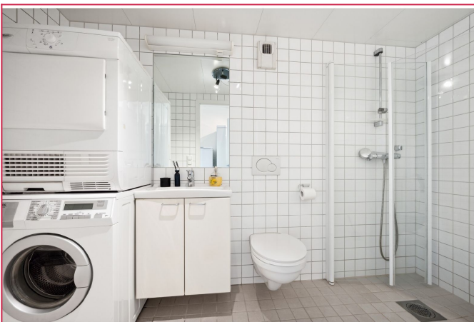
Moderne bad med vaskemaskin og tørketrommel