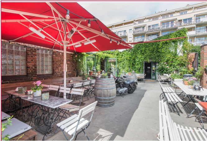
Populære Oslo Mekaniske verksted beliggende rett i nærheten