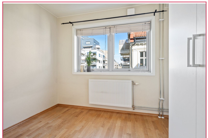
Soverom 2 av 3