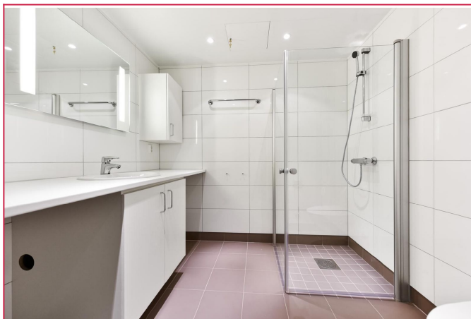
Lekker bad med opplegg for vaskemaskin og tørketrommel.