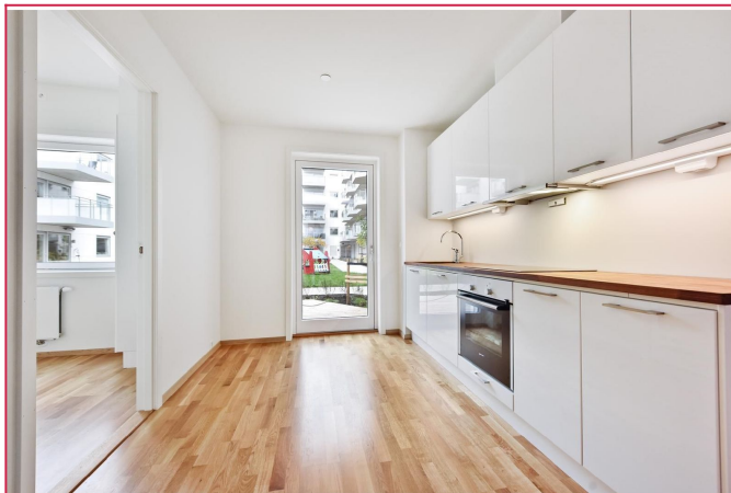
Utgang til terrasse fra kjøkkenet. Integrert ovn, steketopp og oppvaskmaskin.

SAKSNUMMER 57815 - SØRENGKAIA 116, 0194 OSLO