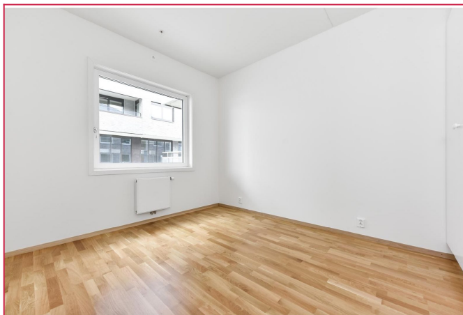
Hovedsoverom med garderobeskap.