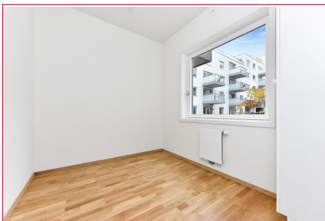
Soverom to med garderobeskap og dobbeltseng medfølger