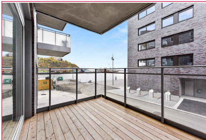
Balkong med sjøutsikt.