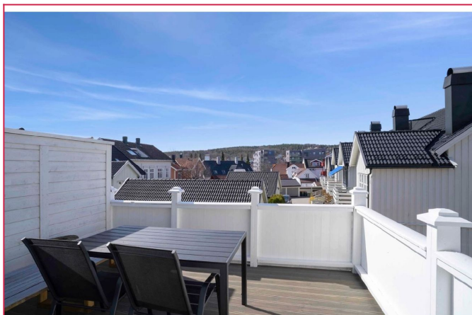
Sameiet har to felles balkonger.