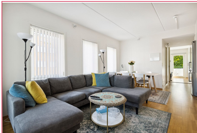
Lysinngang fra tre sider og store vindusflater gjør at leiligheten oppleves lys og luftig.