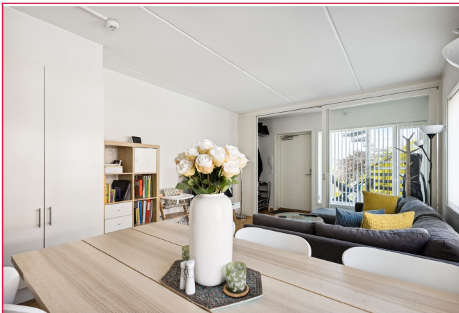
God plass for flere sittegrupper i stuen.