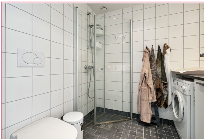
Flislagt bad, utstyrt med servant på innredning, dusjhjørne med glassdører og toalett.