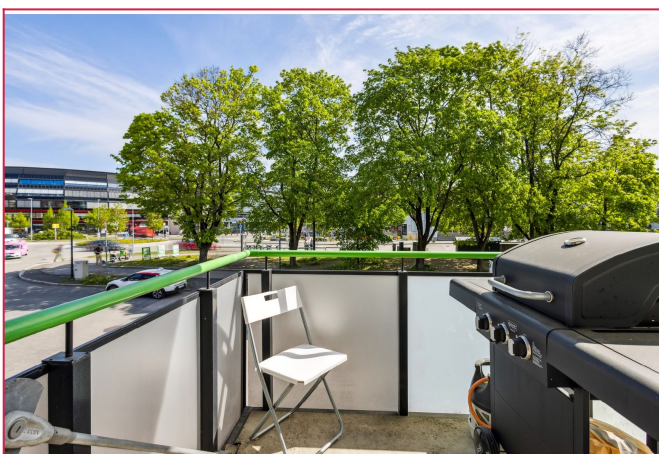
Balkong med plass for en liten sittegruppe/grill.