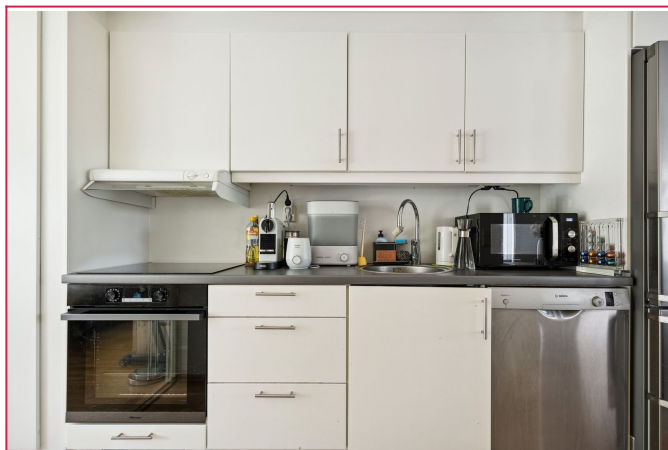
Kjøkkenet med oppbevaringsplass i over- og underskap. Hvitvarer medfølger.