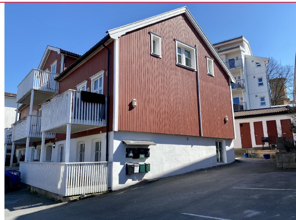
Liten utvendig bodd medfølger