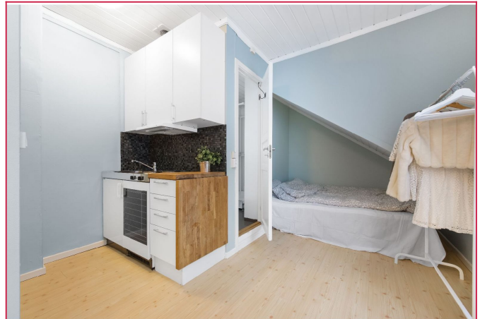
Kjøkkenkrok med kjøleskap og steketopp. Kjøkkenbenk kan forlenges.