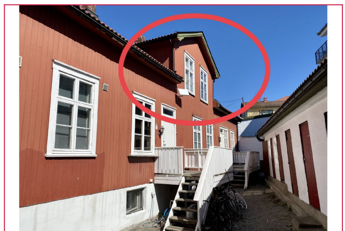
Leiligheten ligger i 2.etg