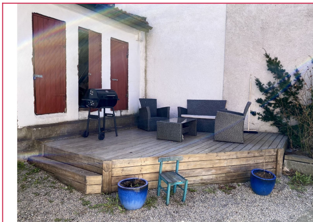
Felles sittegruppe ute