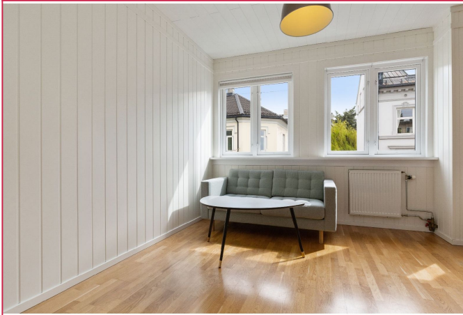
Stue med møbler som på bilde. Oppvarming er inkludert.