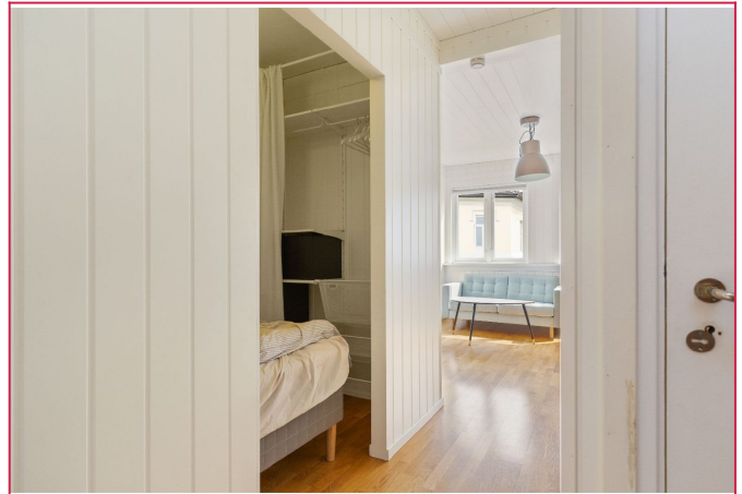
Entre - Venstre side har man seng. Høyreside er det Bad