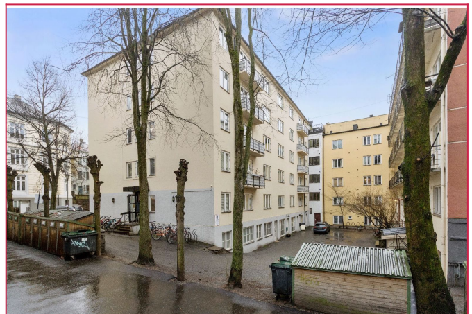
Fasade - Inngang er døren til venstre på bilde