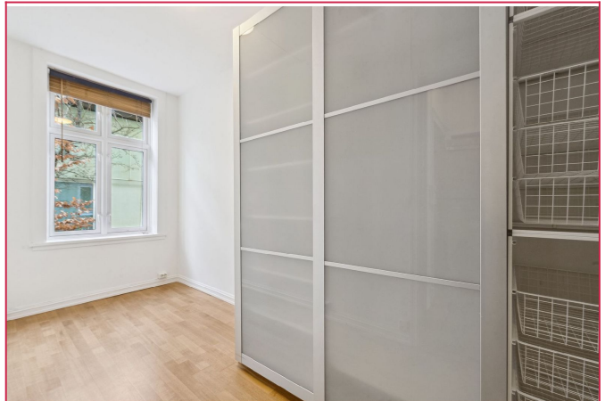
Soverom med dobbeltgarderobe