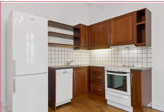
Kjøkken / åpent mot stua