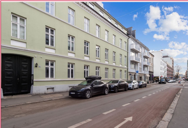
Fasade - leiligheten er ledig omgående