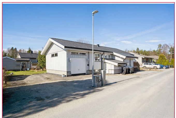
Kreklingveien 7 - Leiligheten ligger i underetasjen