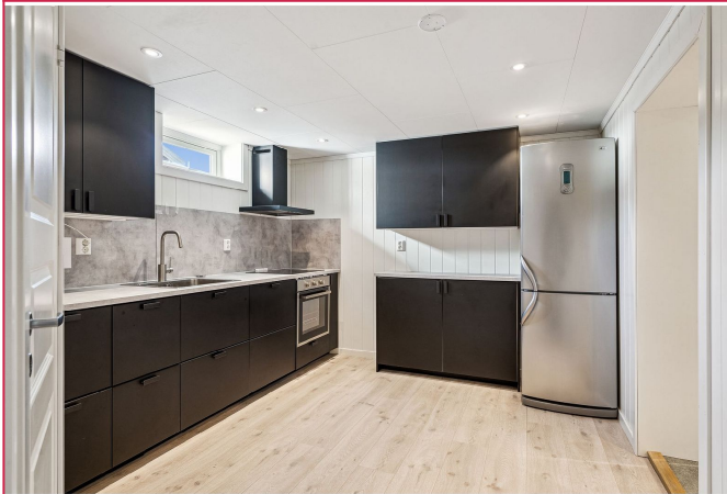
Kjøkkenet er innredet med kjøleskap, platetopp, stekeovn og oppvaskmaskin