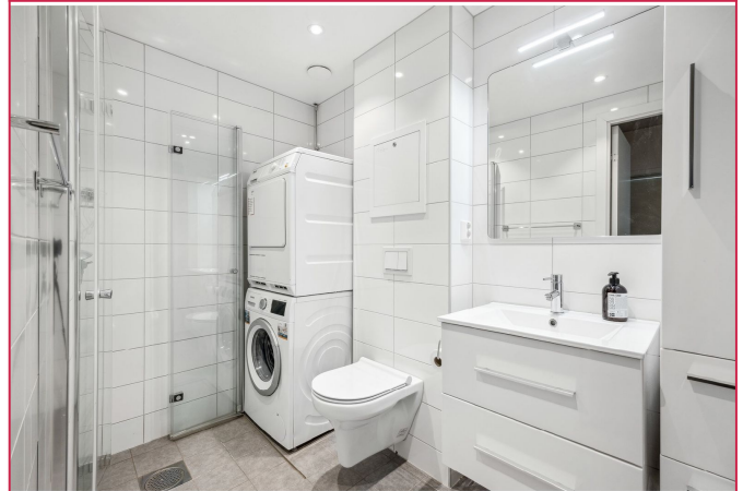
Lyst og pent bad