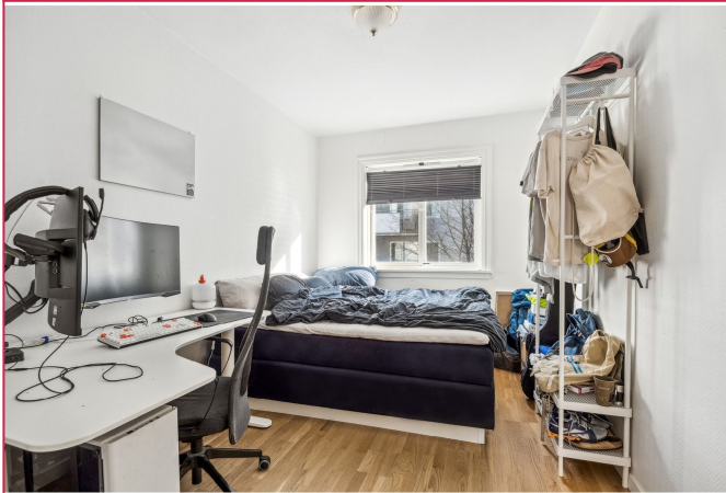
Hovedsoverom med god plass