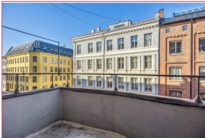
Solrik vestvendt balkong