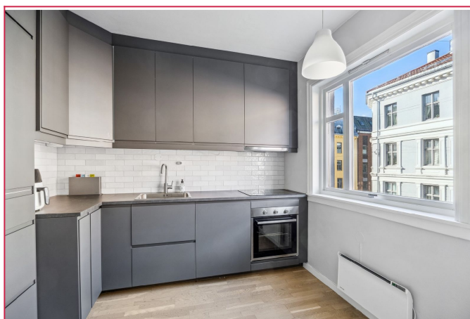
Kjøkkenen med integrerte hvitevarer