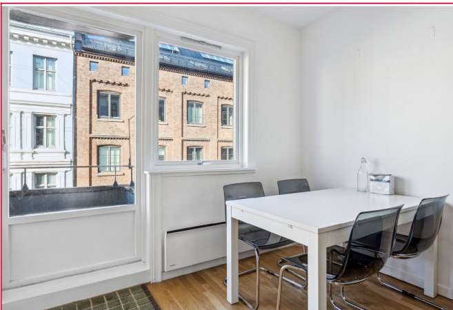
Plass til spisebord og utgang til balkong