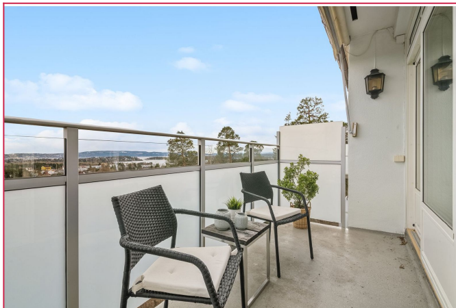
Balkong med flott utsikt.