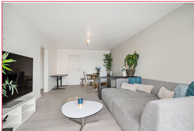
Stue. Møbler følger med.