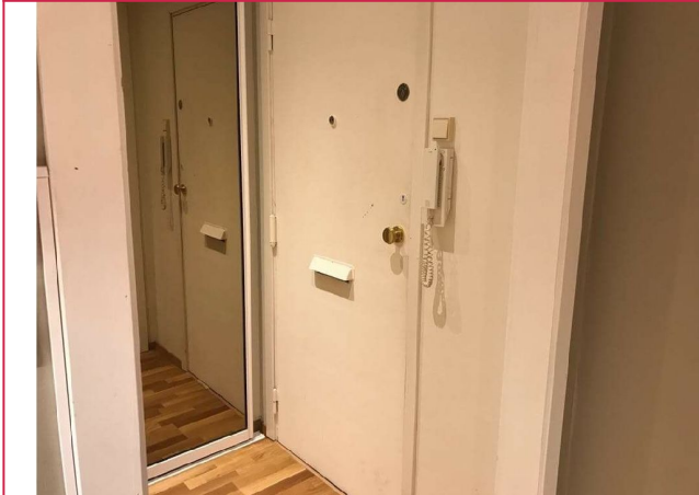
Lys entre med integrert garderobeskap.