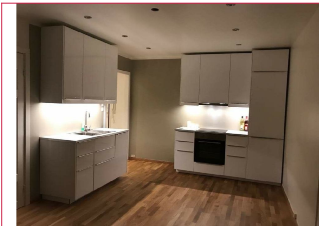
Kjøkkenet med tilhørende integrerte hvitevarer.