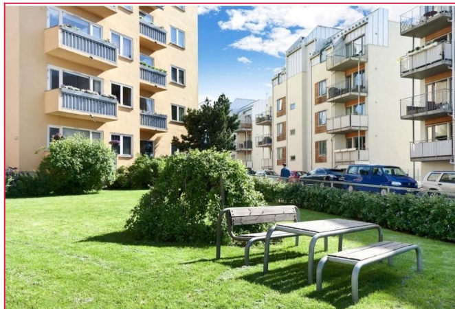
Felles uteområde i sameiet.