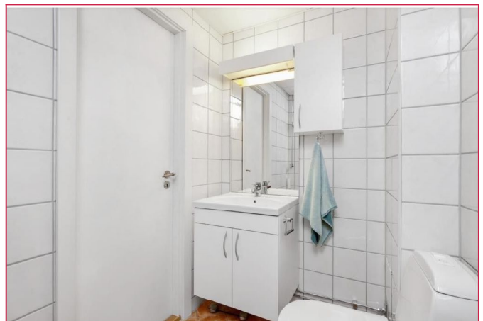
Lyst flislagt bad.