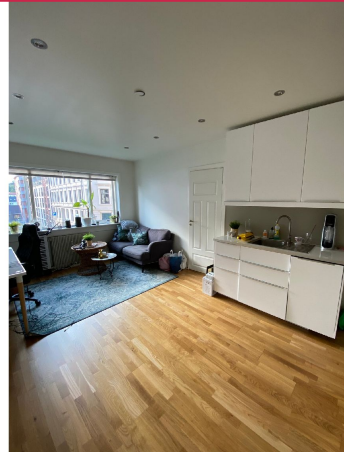
Åpen løsning mellom stue og kjøkken.