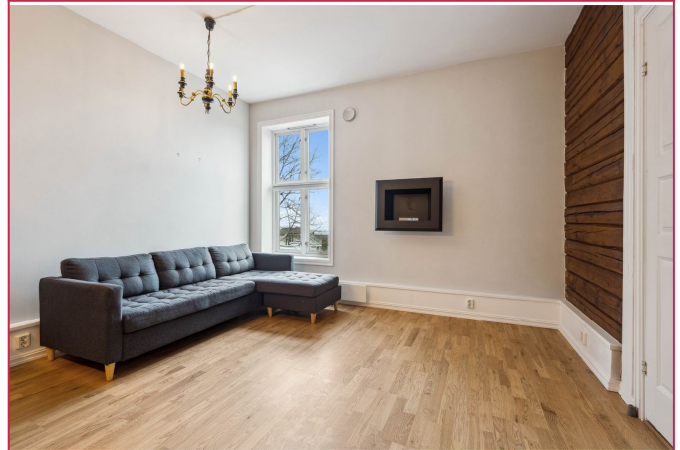
Stue med peis