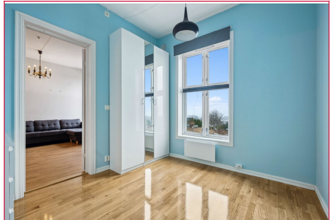
Soverom av god størrelse med plass til dobbeltseng og garderobeskap