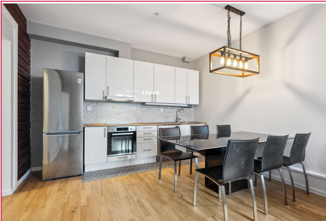
Flott kjøkken med hvitevarer