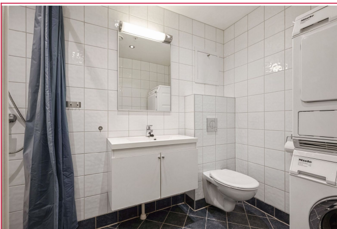
Bad med varmekabler i gulv. Vaskemaskin og tørketrommel medfølger