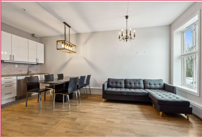
Åpen stue/kjøkken med god plass til spisebord og sofaseksjon.