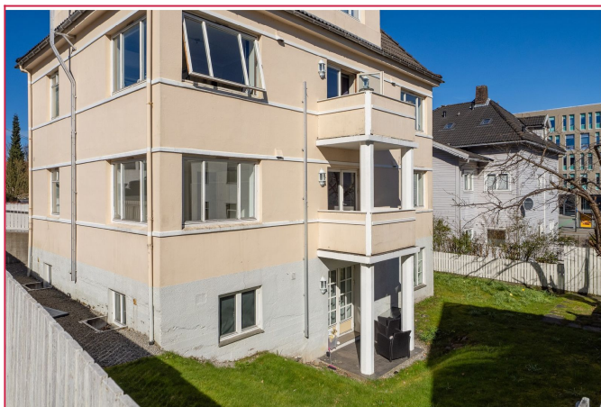
Leiligheten ligger i første etasje