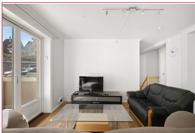
Stue med utgang balkong