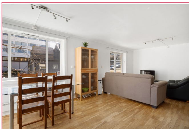
Kjøkken og stue