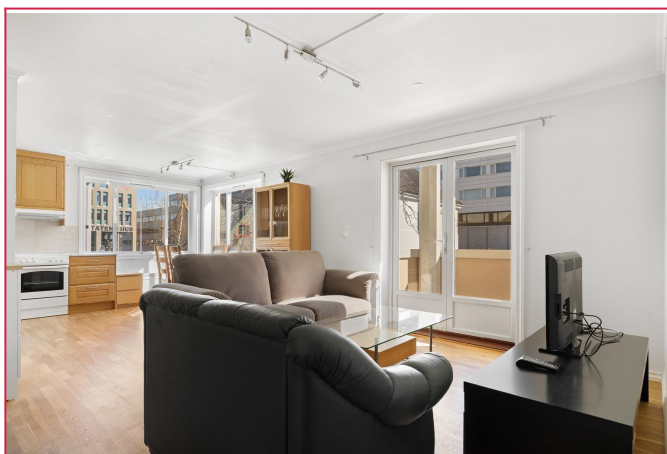
Stue og sofagruppe