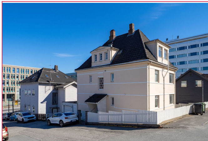
Velkommen til Sverres gate 4