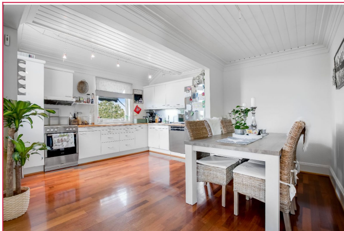
Kjøkken med god plass til spisegruppe