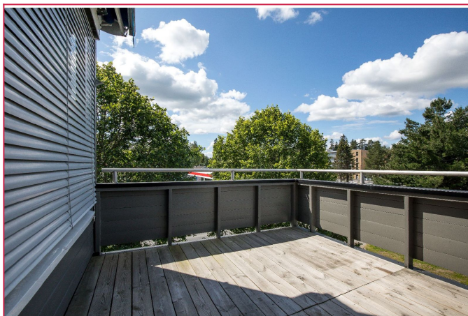
Stor og romslig balkong