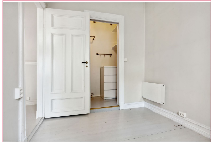
Soverom med omklingsrom