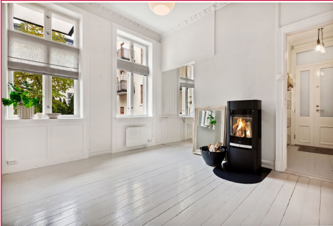
Stue med stukkatur og vedfyrt peisovn. I 2024 ble det satt inn nye vinduer