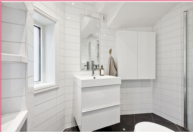
Bad med foldbare dusjvegger