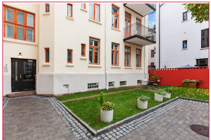
Trivelig bakgård med gressplen og sittegrupper