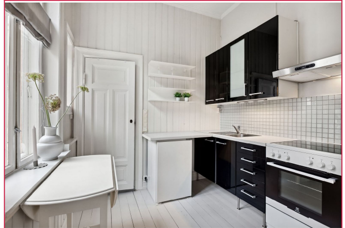
Kjøkkenen med lite spisebord og hvitevarer. Nye fronter vil komme