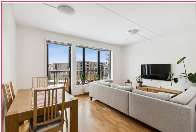
Boligen leies ut møblert, med oppvarming, varmtvann, TV-pakke,nett og garasje plass inkludert i leien