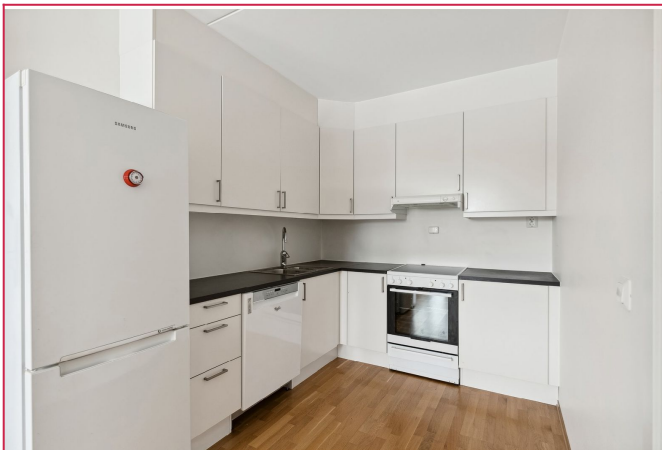
Kjøkkenet med alle hvitevarer inkludert. Rikelig med benke- og skapplass