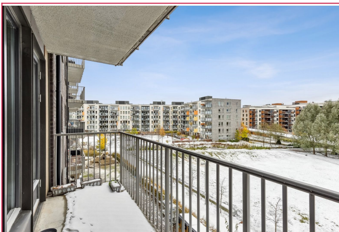
Romslig balkong. Rolig og barnevennlig område på Hasle, med nærhet til "ALT"