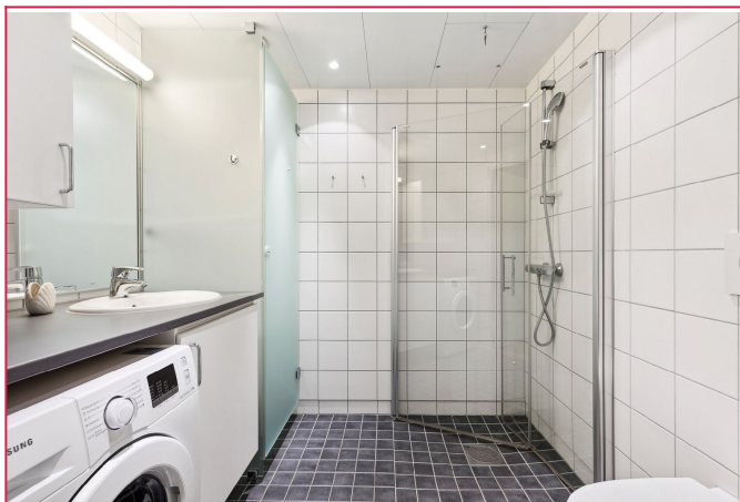
Flislagt bad med varmekabler og vaskemaskin. Plass til tørketrommel