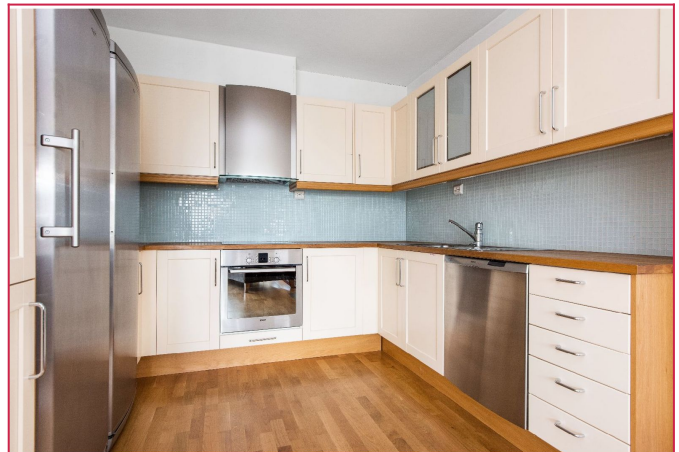
Kjøkkenet med hvitevarer og mye benk/skapplass.