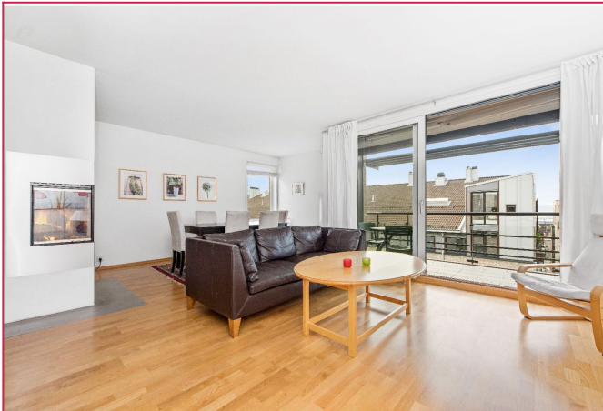
Stue med utgang til balkong. Møbler som anvist på bildet fjernes.