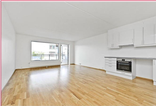
stue og kjøkken