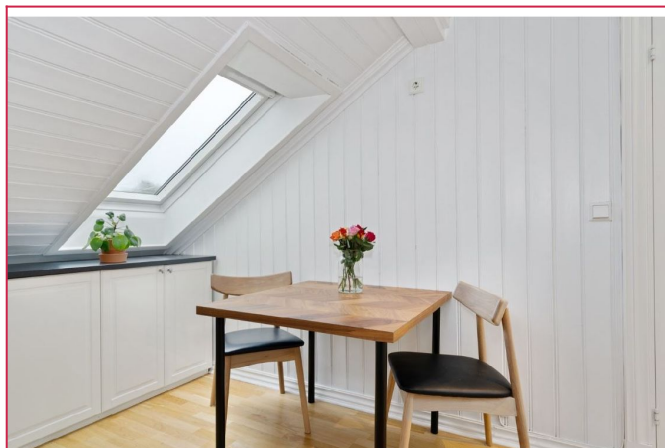
På kjøkkenet er det plass til kjøkkenbord.