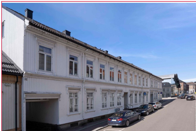
Flott 3-roms leilighet i Tønsberg sentrum.