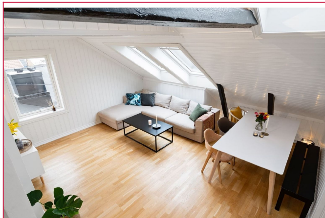
Stue med en unik takhøyde!