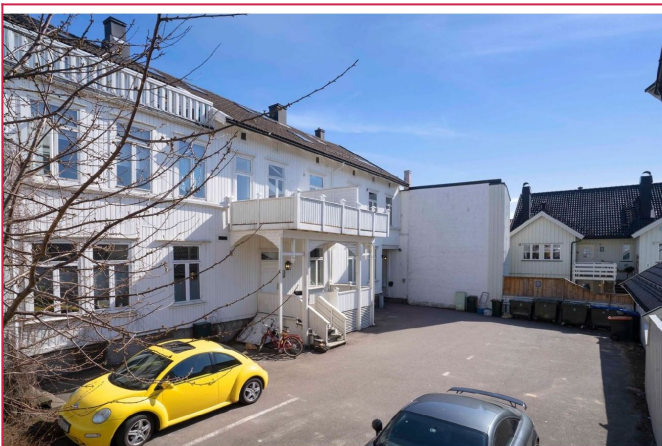
Velkommen til visning!