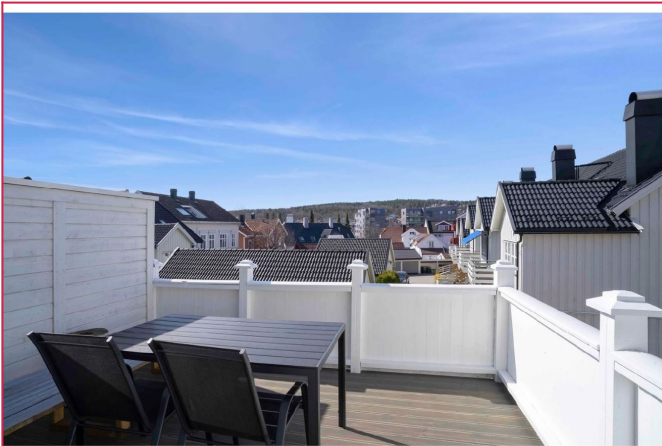
Sameiet har to felles balkonger.