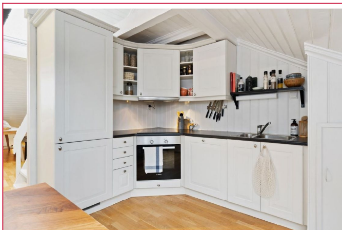
Lyst og fint kjøkken med integrert kombiskap, oppvaskmaskin, komfyr og steketopp.