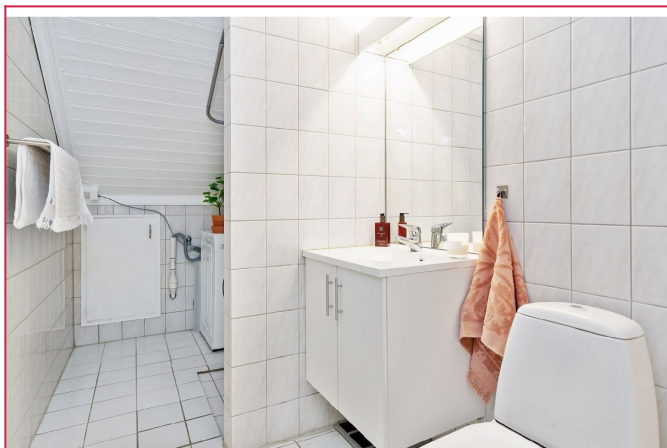
Flislagt baderom med toalett, servant m/innredning, dusj og opplegg for vaskemaskin.