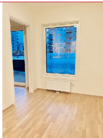
Soverom med "lailaløsning" og vindu mot markterasse