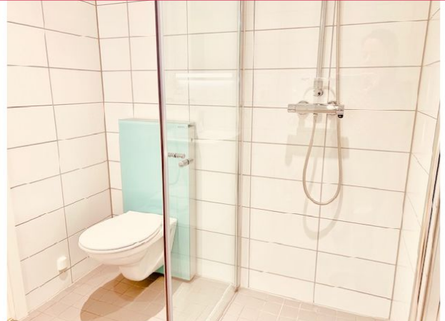
Vegghengt wc og dusj med innfellbare glassvegger