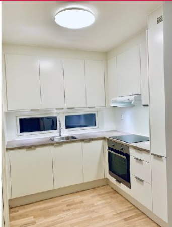
Stilrent kjøkken med integrerte hvitevarer