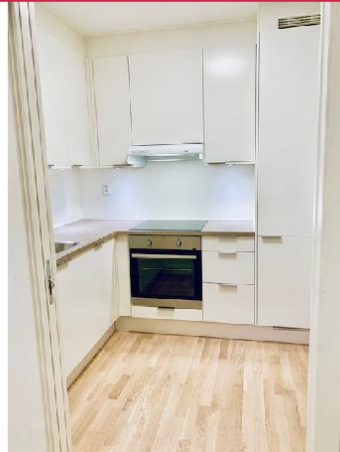
Kjøkkenet sett fra soverom