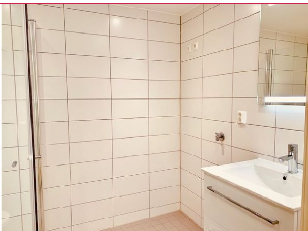
På badet er det dusjhjørne, servant, toalett og opplegg for vaskemaskin