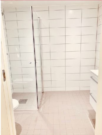
Lyst og delikat bad - her er det opplegg for vaskemaskin og tørketrommel