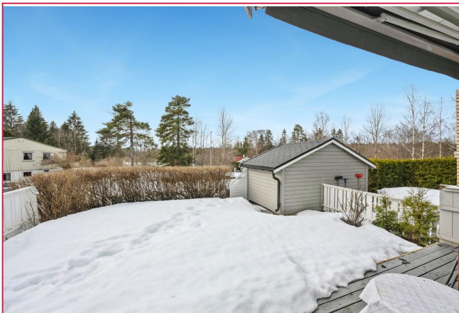
Privat hage med gode solforhold