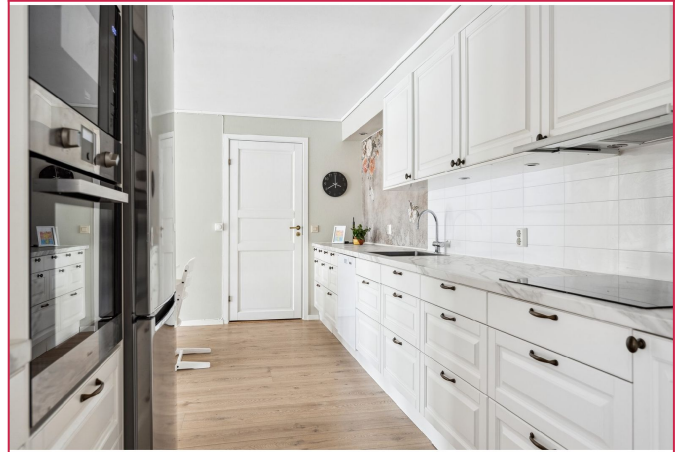
Flot kjøkken med komfyr, steketopp, mikro og kombiskap.