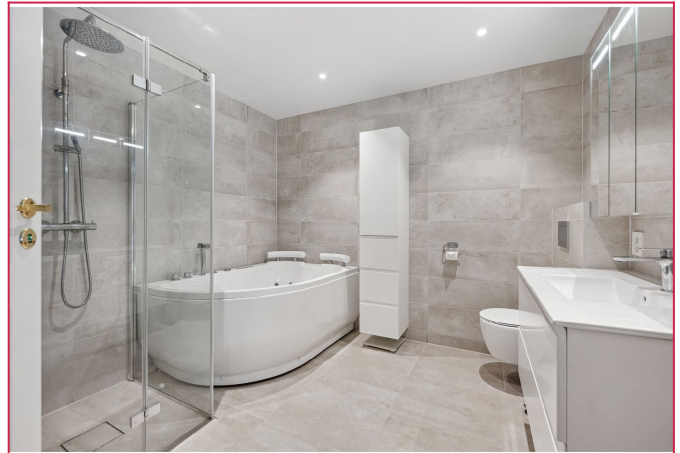
Lekker bad med dusj og boblebad