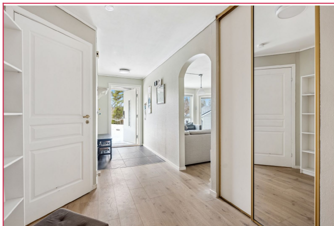
Stor entrè med god lagringsplass