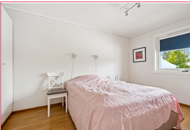
Master bedroom med garderobe