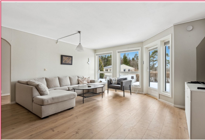
Stor og koselig stue med utgang til privat hage