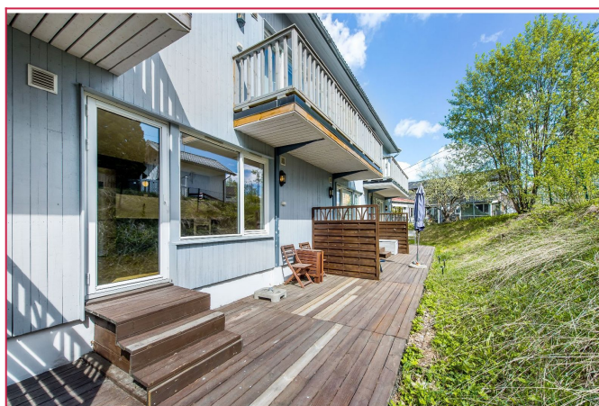
Egen markterrasse med utgang fra stue