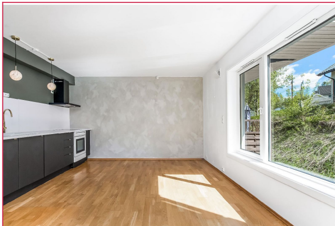
Kjøkken/stue. Her er det gode møbleringsmuligheter.