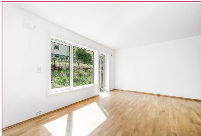
Stue med utgang til hyggelig markterrasse