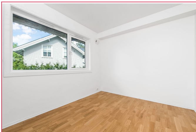
Soverom. Det er et frittstående garderobeskap på rommet.