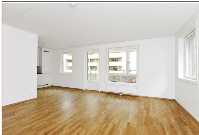
åpen stue/kjøkken-løsning med utgang til balkong