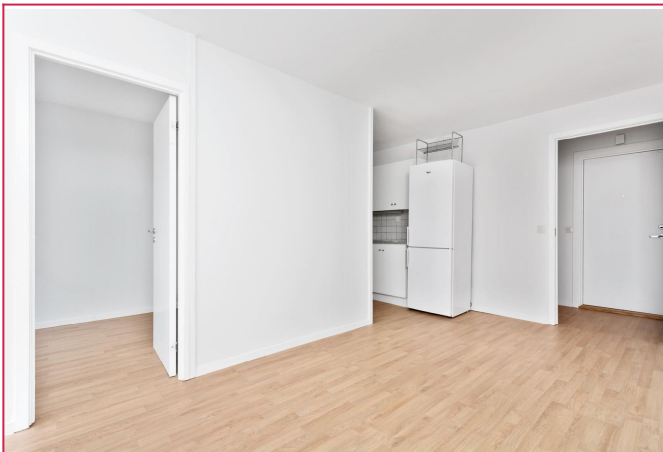
stue mot kjøkken