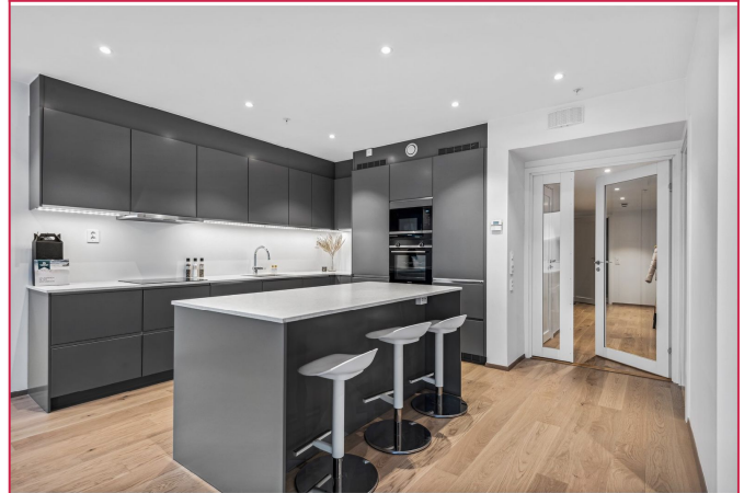
Nydelig kjøkken med integrerte hvitevarer