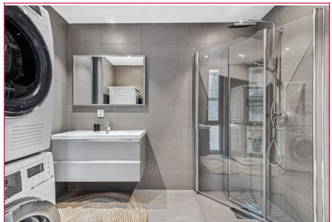
Privat bad i tilknytning til hovedsoverom