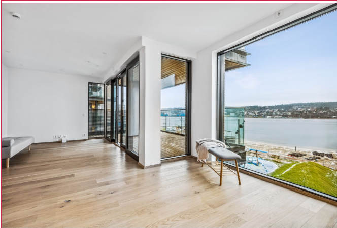
Nydelig sjøutsikt fra store vindusflater i stue