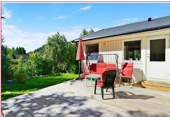
Terrasse og hage