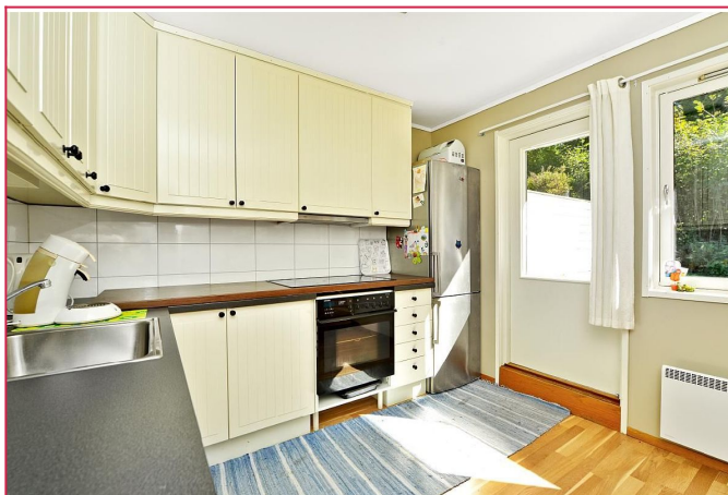
Kjøkkenen med utgang terr. og hage