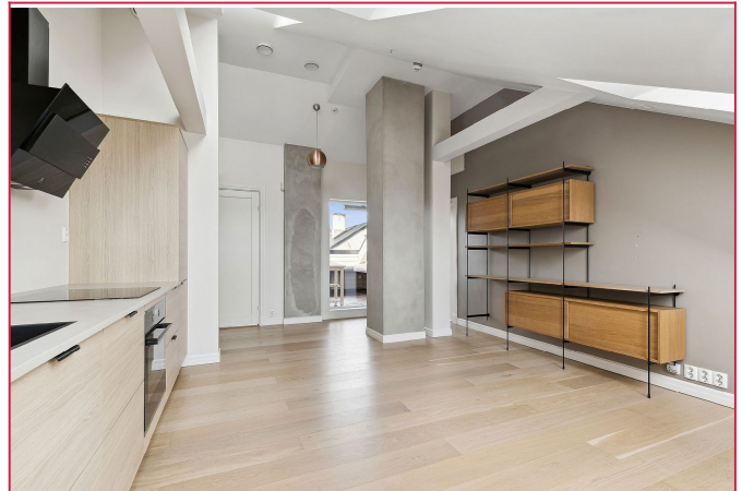
Åpen løsning mellom kjøkken og stue