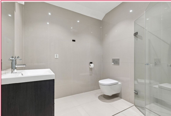
Pent flislagt bad, med varmekabler, regnfallsdusj og vaskemaskin.