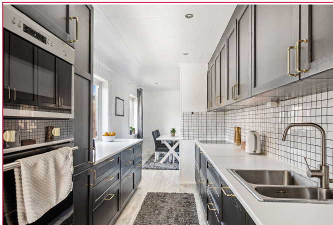
Kjøkkenet er moderne og har rikelig skap- og benkeplass. Perfekt spisestue-område i stue