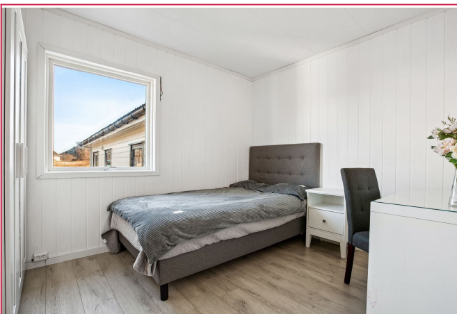
Leiligheten har 3 gode soverom - leies ut umøblert