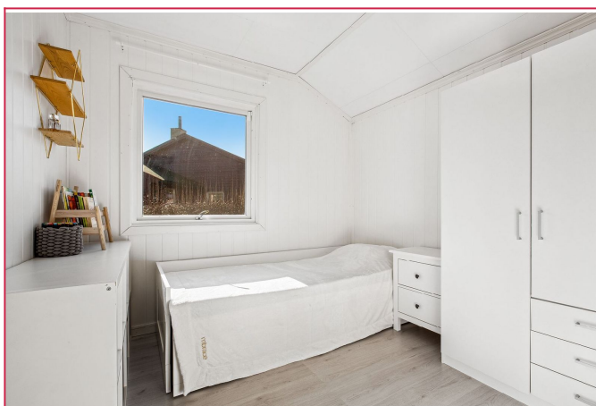
I leien er både strøm, varmtvann, internett og parkering inkludert!