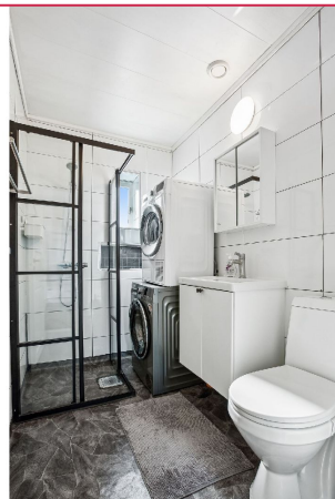
Pent flislagt bad - Vaskemaskin og tørketrommel medfølger