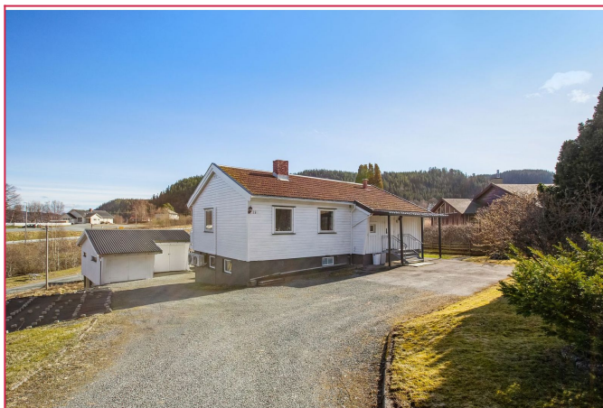
Her har du et vakkert uteområde på fremsiden av boligen- Parkering i garasje på nedsiden av huset