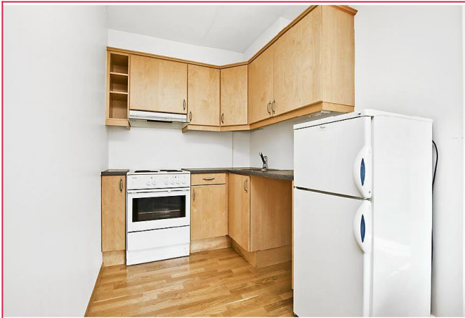
Kjøkkenet med fronter i bjørk. Mulighet for å sette inn oppvaskmaskin.