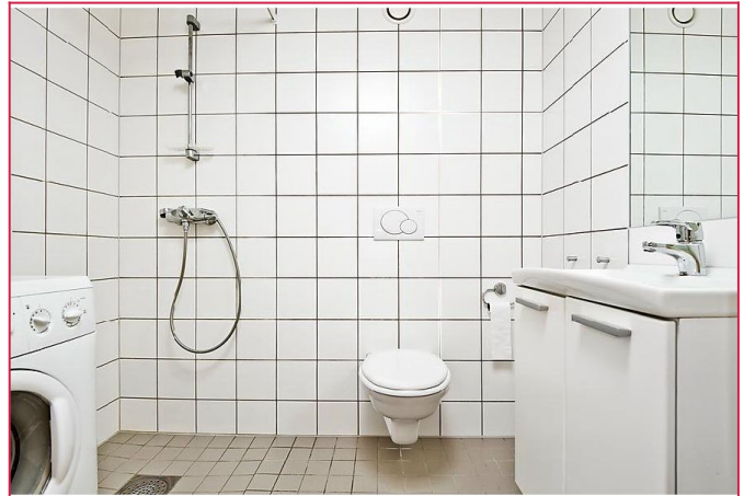
Flislagt bad med dusj, vegghengt wc, servant med underskap, og opplegg for vaskemaskin