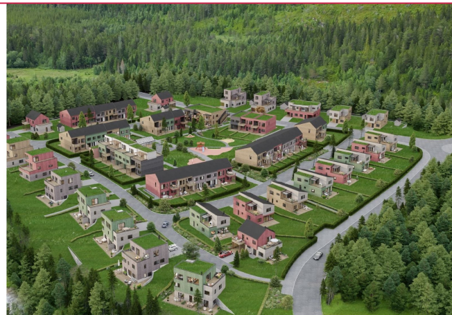
Eneboligen ligger i et nyetablert område på Trøåsen i Klæbu