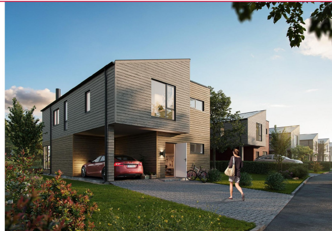
Fasade - Illustrasjon