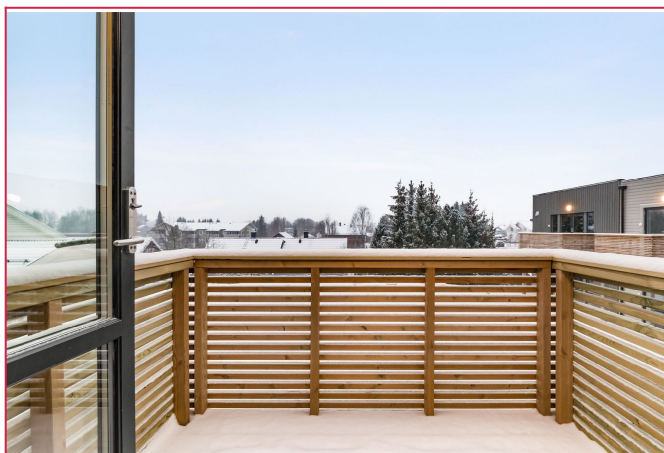
Balkong med gode solforhold