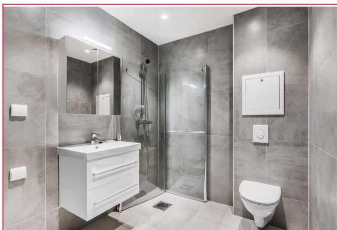
Moderne bad med dusjhjørne og opplegg for vaskemaskin