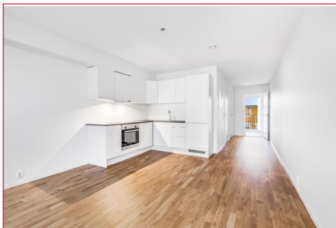
Åpen stue/ kjøkken- Integreerte hvitevarer

SAKSNUMMER 33618 - AAGOT CHRISTOPHERSENS VEG 20A, 2040 KLØFTA